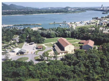
L'Hôtel Vallée Bleue, à deux pas de la base de loisirs du même nom, en face des monts du Bugey.

15h30 – 19h15 : Échauffements et répétitions.