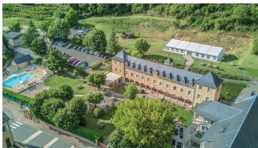
Le village-vacances L'Oustal Pont-les-Bains de Salles-la-Source.

Au restaurant : cuisine régionale et gourmande, basée majoritairement sur des approvisionnements en circuit court. Vin à discrétion à table.